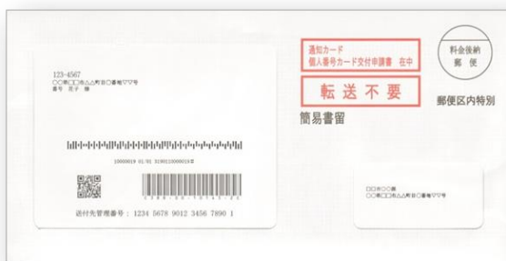
【Ficha de notificación】 (Frente)