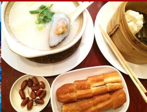
▲中国粥と揚げパン