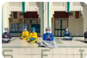
2. マレーシア セントフランシス学園