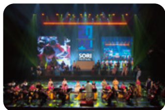
3. 韓国 全羅北道子ども芸術団