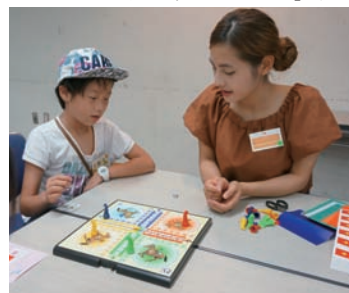
▼ベトナム「コーカーゲーム」で遊ぶ