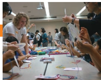
▲カナダ「ドリームキャッチャー」作り体験

参加者の皆さんは、カナダの先住民族の間で伝わるお守り「ドリームキャッチャー」作りや、ベトナム版すごろく「Cờ Cờ Ngựa」、中国の伝統工芸「剪纸(切り絵)」など、日本ではなかなか体験できない遊びや文化を満喫しました。