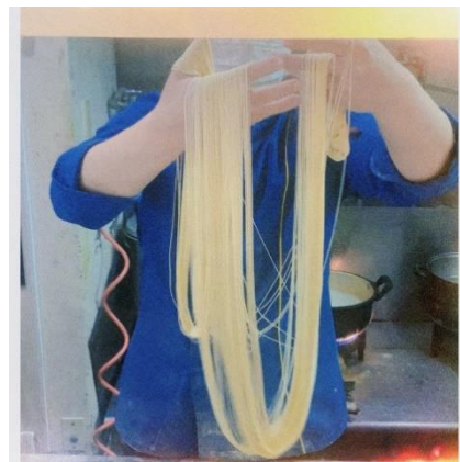
细面(面不断是关键)