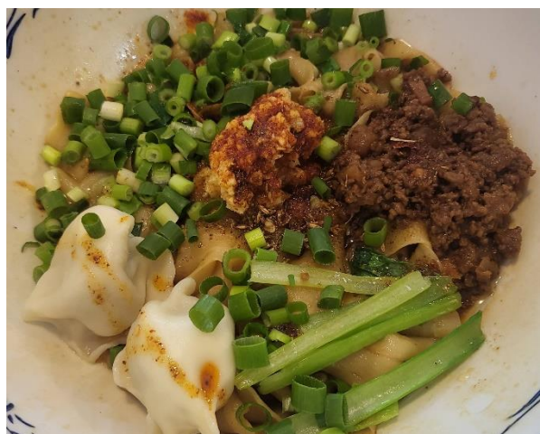
豪华油泼面(带水饺)