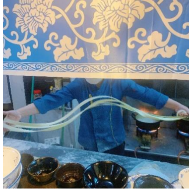
50mm 면을 만드는 모습