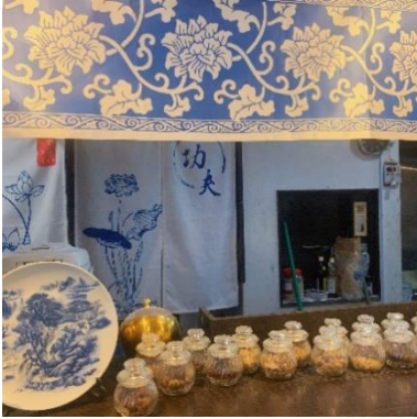
가게에 놓여져 있는 한약재