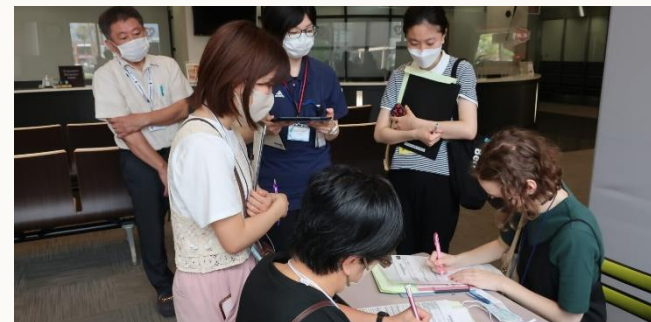
(위)요네모리 병원 투어 사진

유료 관람석 구입은 홈페이지를 확인해 주십시오. 일시 : 8월 19일(토) 19시 20분~20시 40분 장소 : 가고시마 본 항구 문의 : 산산콜 가고시마 ☎808-3333 홈페이지 : origin.kankou-kagoshima.jp