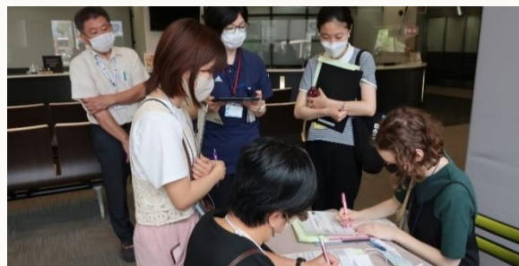
(图) 参观米盛医院时的现场照片

origin.kankou-kagoshima.jp 时间：8月19日(周六) 19:20~20:40 地点：鹿儿岛港本港区域 咨询：sun sun call 鹿儿岛 ☎808-3333