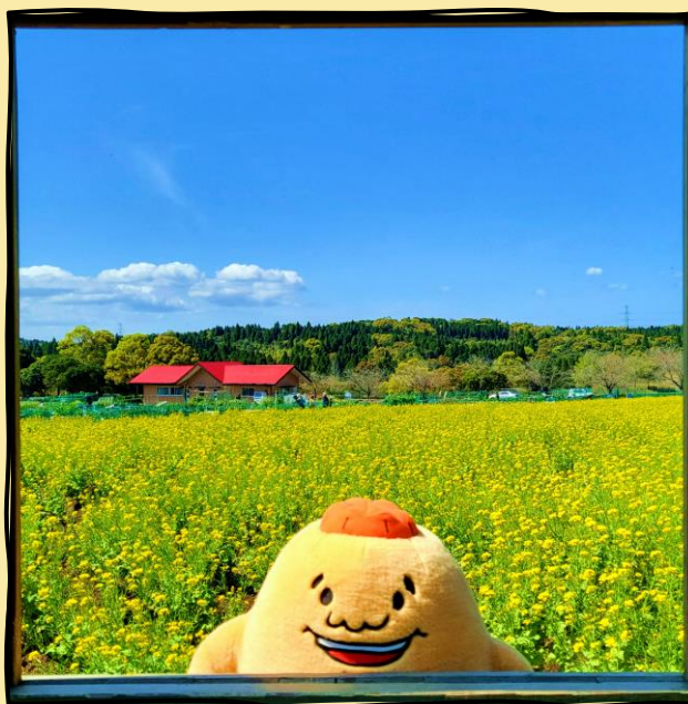
리키농도 꽃밭을 만끽하고 있어요♪

이번에는 마그마시티의 PR캐릭터인 마그농 중 “리키농”을 데리고 이누자코초에 있는 가고시마시 도시 농업 센터에 방문해 「사계절 화원」에 있는 유채꽃을 즐기고 왔습니다.