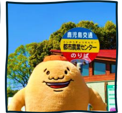
버스로 올 수 있어요!

[유채꽃은 4월 초까지입니다. 계절이 바뀌면 다른 꽃을 볼 수 있습니다.]