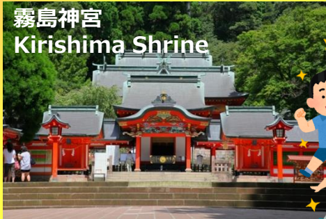
霧島神宮 Kirishima Shrine

毎年、たくさんの日本人・外国人の参加者同士で、楽しい旅行の思い出を作ってきた国際交流探訪バスツアー。