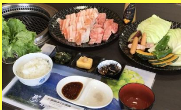
高千穂牧場 Takachiho Farm

We had great memories with many Japanese and foreign participants in this "KIEX International Bus Tour" each year.